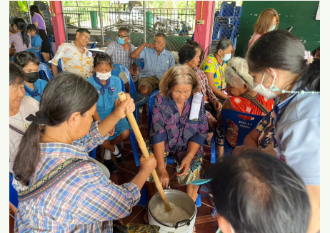
เที่ยวนาพาเพลิน

พื้นที่ส่วนใหญ่ของหมู่บ้านเป็น ที่ราบลุ่ม ประชาชนส่วนใหญ่ของ หมู่บ้านมีอาชีพทำนา