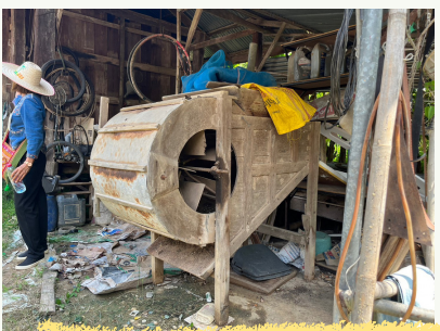
เครื่องมือเครื่องใช้