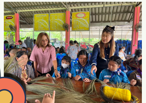
ภูมิปัญญาท้องถิ่น