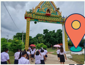
วัดเสาชิน ราชฐ์บำรุง